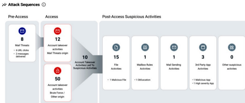
Figura 2. Il report Attack Sequence (Sequenze d'attacco) mostra le minacce all'accesso in tutte le fasi della catena d'attacco.